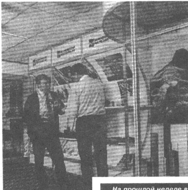
На прошлой неделе в Москве, во Всероссийском выставочном центре, три дня работала Первая московская международная выставка «Охрана окружающей среды-96» («Топливо-энергетический комплекс», «Энергетика», «Горнодобывающая промышленность»). Торжество по поводу внесло свой шарм в отнюдь не спокойную жизнь бывшей ВДНХ. Хотя бы тем, что с утра военный оркестр встречал браваурными маршами прибывающих на открытие гостей со всего мира.