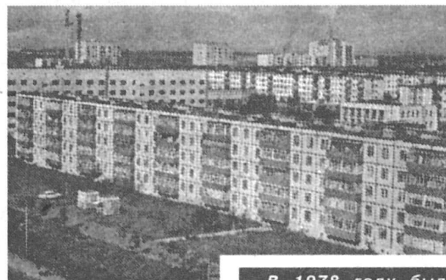
В 1978 году были приглашены в НГДУ «Сургутнефтегаз» сотрудники Академии коммунального хозяйства для ознакомления с коммунальным хозяйством нефтяников. Были даны рекомендации: на 8-10 микрорайонов строить производственно-бытовые здания коммунального назначения, которые помогут правильно эксплуатировать панельные здания, инженерные сети, дороги, проезды, озеленение.

Основными помещениями здания были названы: диспетчерские, операторские, участки по ремонту квартир, мастерские санитарно-технических работ, электротехнических работ, гаражи спецтехники и т.д. Диспетчерские должны принимать от жильцов квартир заявки о неполадках, регистрировать их, указывать сроки устранения, фиксировать давление и температуру в теплосистеме, анализировать квартальные и годовые поступления заявок и аварий.