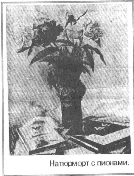
Натюрморт с пионами.

— Одно другому не мешает. А акварели я пишу потому, что возникают порой такие чувства, которые можно выразить только с их помощью. Ведь определенное