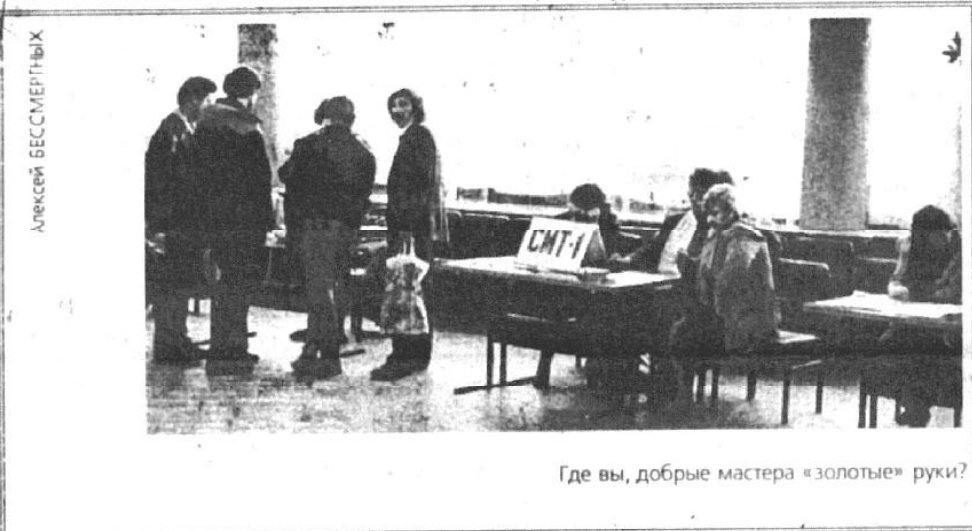
Где вы, добрые мастера «золотые» руки?