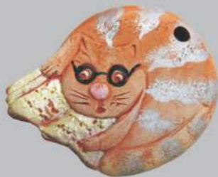
Глиняные фигурки героев произведений А.С. Пушкина