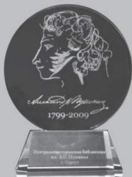
Плакетка к 210-летию поэта