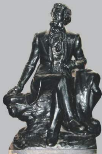
Скульптура «А.С. Пушкин в Болдино». Автор: А.И. Просвирин. Каслинское литье, чугун.