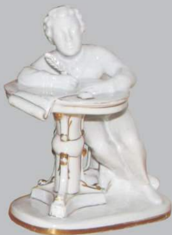
Статуэтка «Юный Пушкин за столом». Автор: С.Б. Велихова. Ленинградский фарфоровый завод. 1949 г.