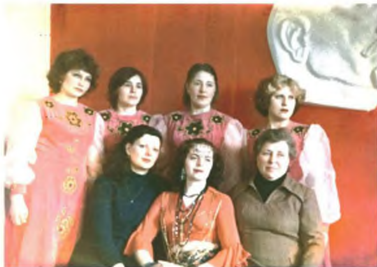
Участники художественной самодеятельности.