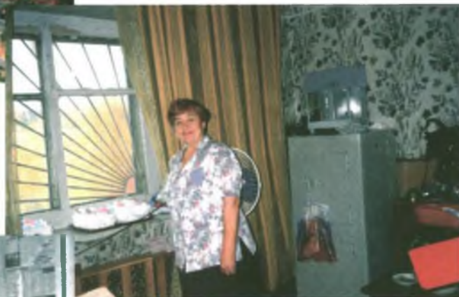
Встречают и провожают своих ветеранов.