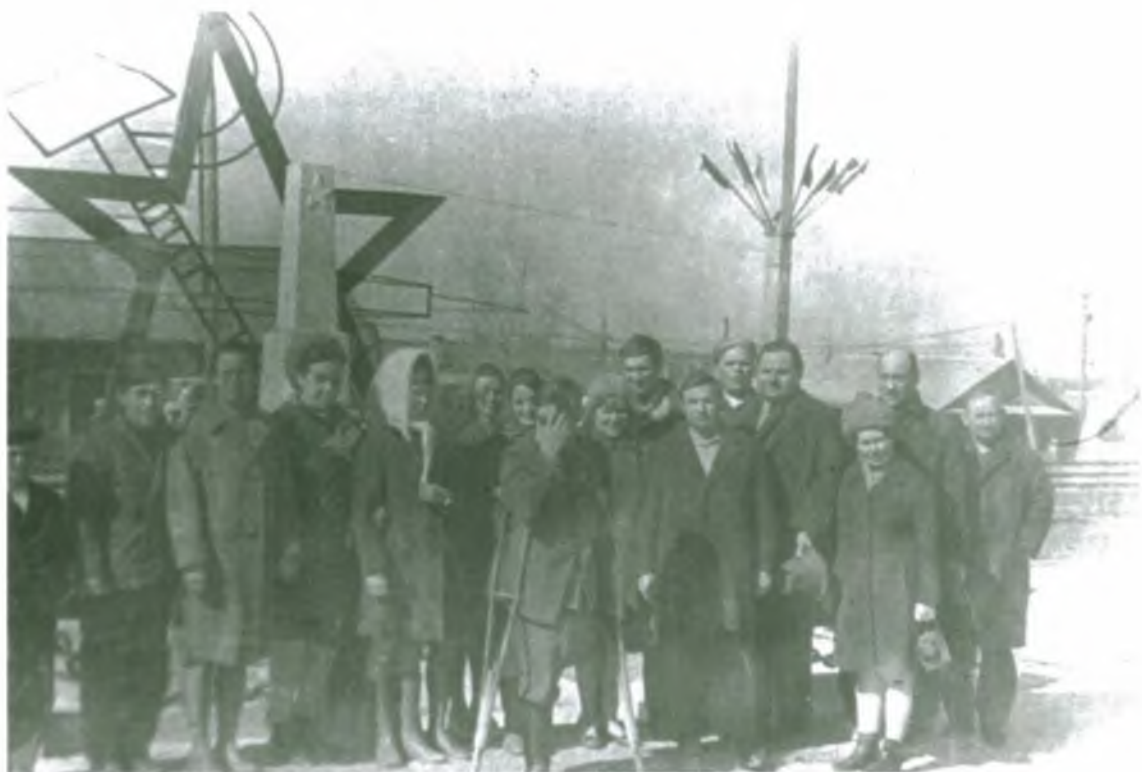
Специалисты Сургутского райрыболовпотребсоюза