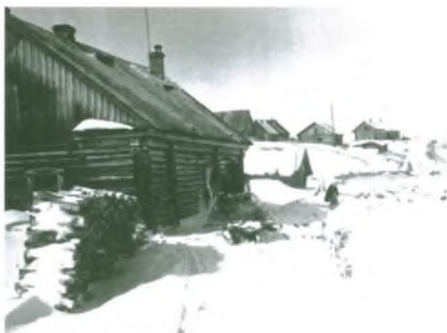
Хлебопекарня в с. Покур