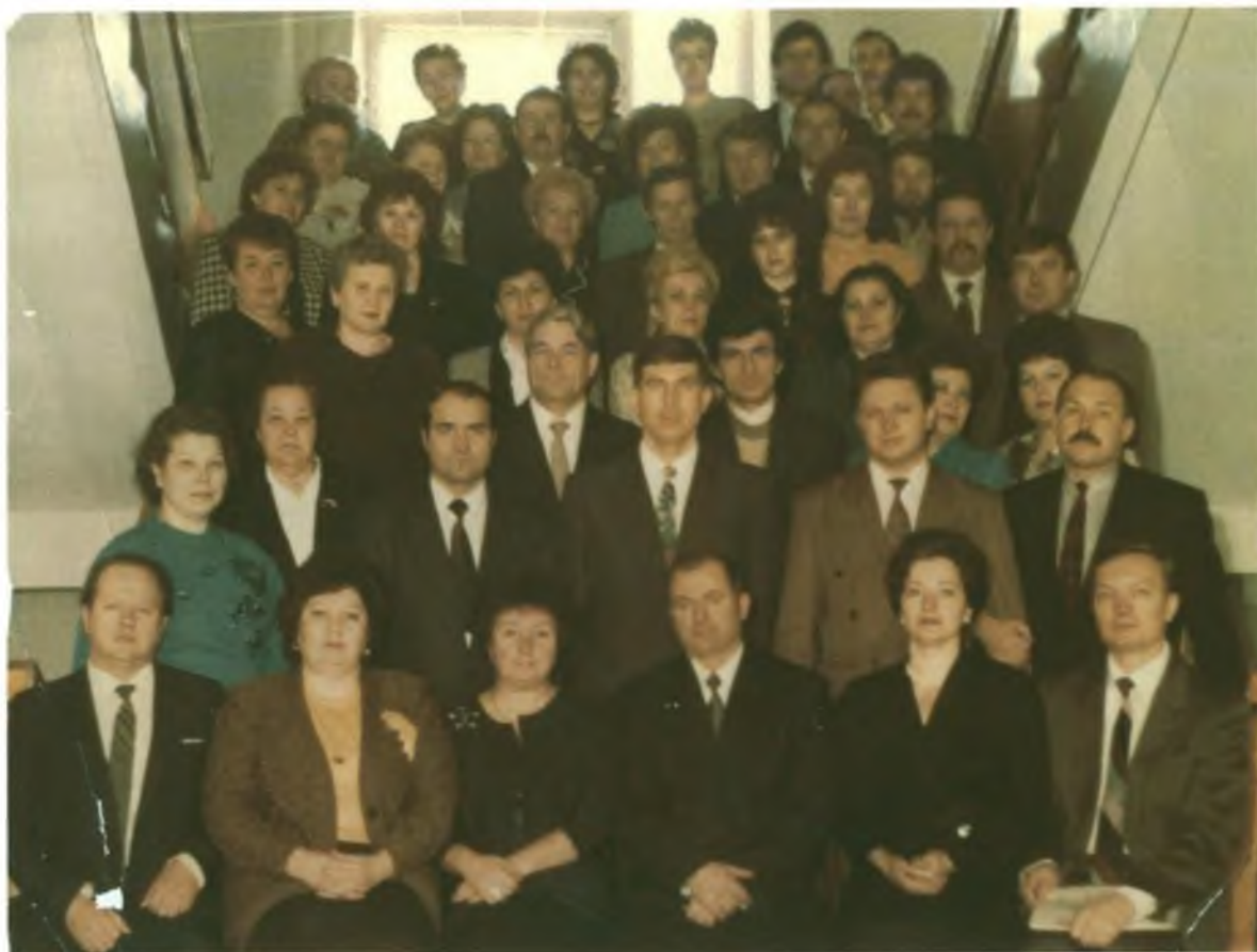
Областное собрание уполномоченных представителей пайщиков. Июнь, 1991 год.