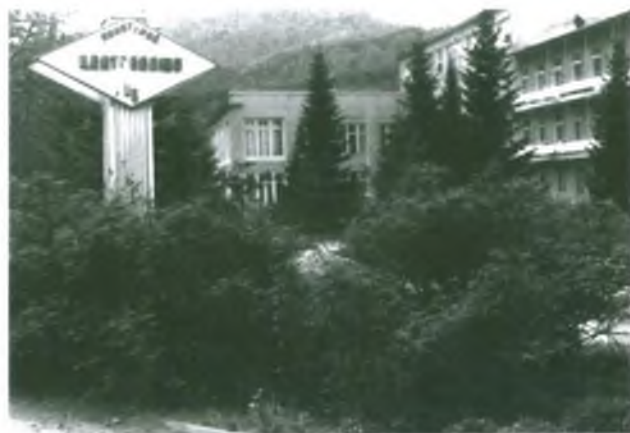
Санаторий «Центрасоюз», г. Белокуриха