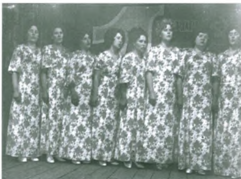
Хор Локосовского сельпо