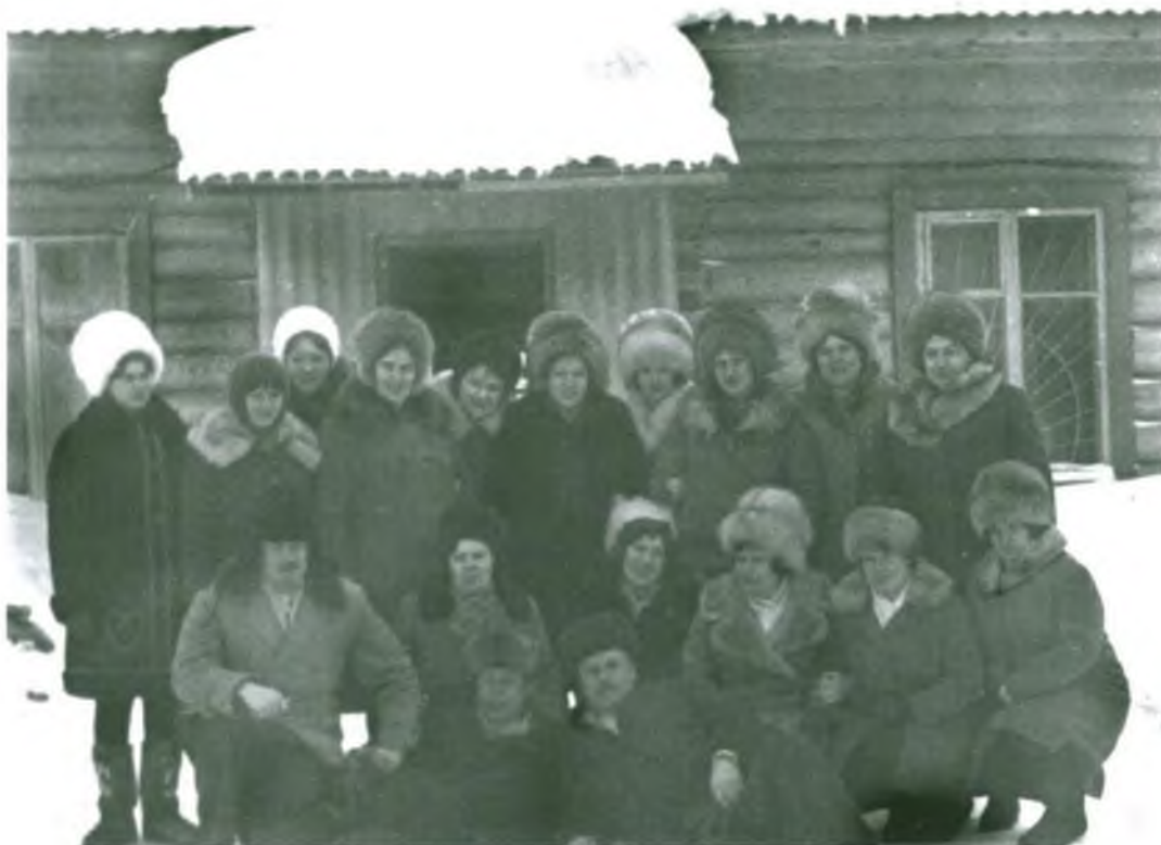
Коллектив торговой базы