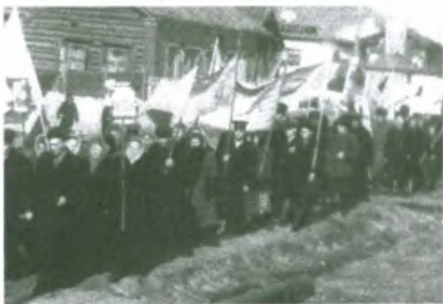
Работники Сургутского райрыболовпотребсоюза 1938 г.