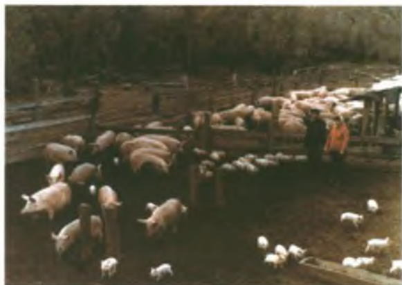
Остров "Тюменцев" Сюда завозился крупнорогатый скот, купленный у населения, здесь же находилась и свиноферма.