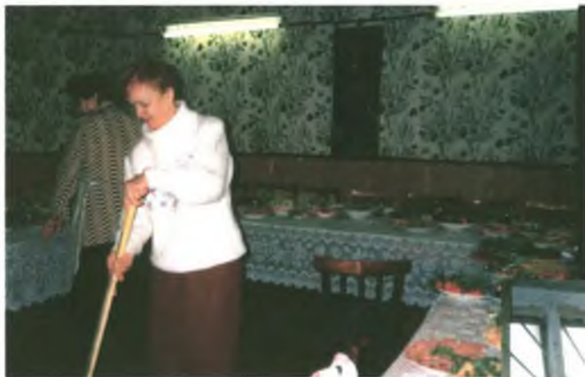
Моют и убирают