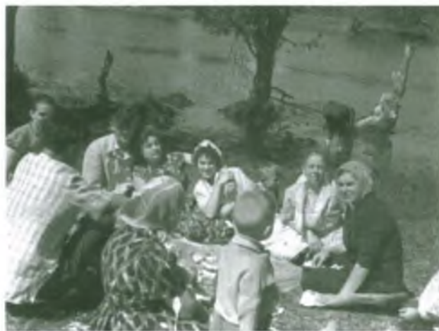
Празднование на природе Дня потребительской кооперации