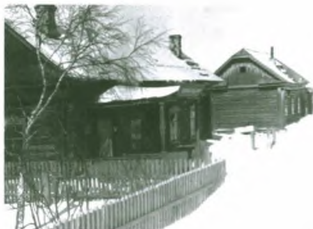
Новый Покур. Магазин промышленных товаров №2