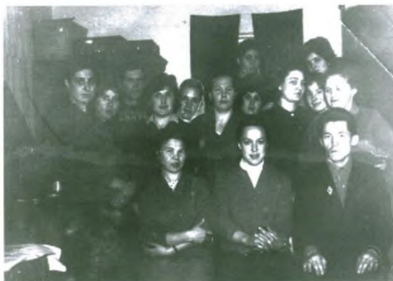
Первый выпуск школы-магазина при РРПС.