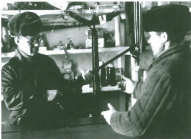
Магазин хозяйственных товаров