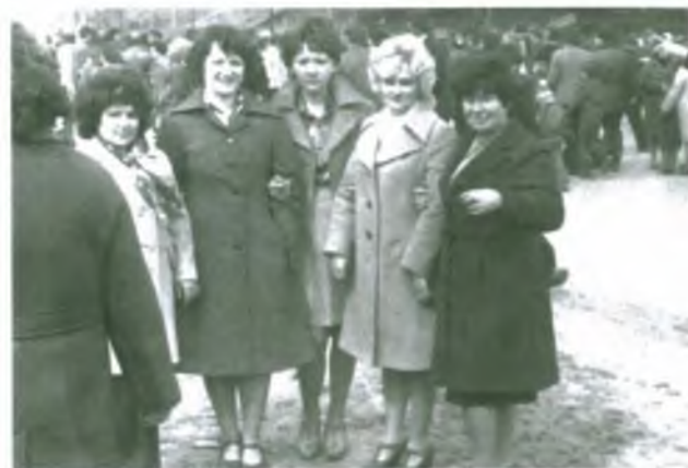
Коллектив торговой базы