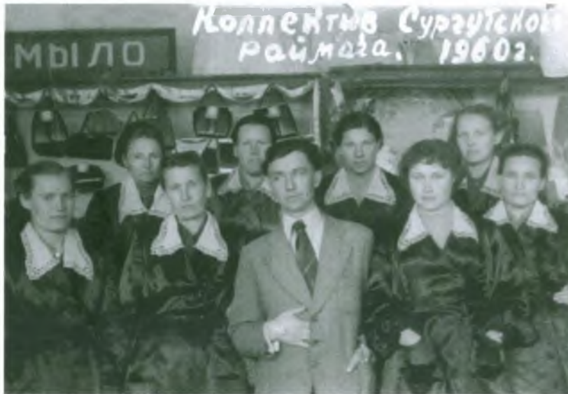
Коллектив Сургутского раймага, 1960 год.