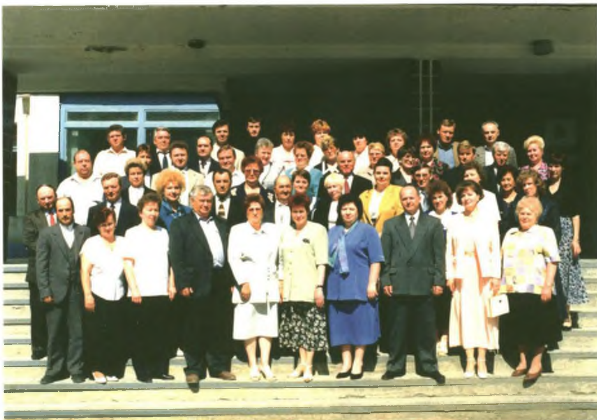
Собрание Облсеверпотребсоюза, г. Тюмень. Июнь, 1998 год.