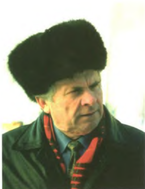
Валентин Федорович Солохин