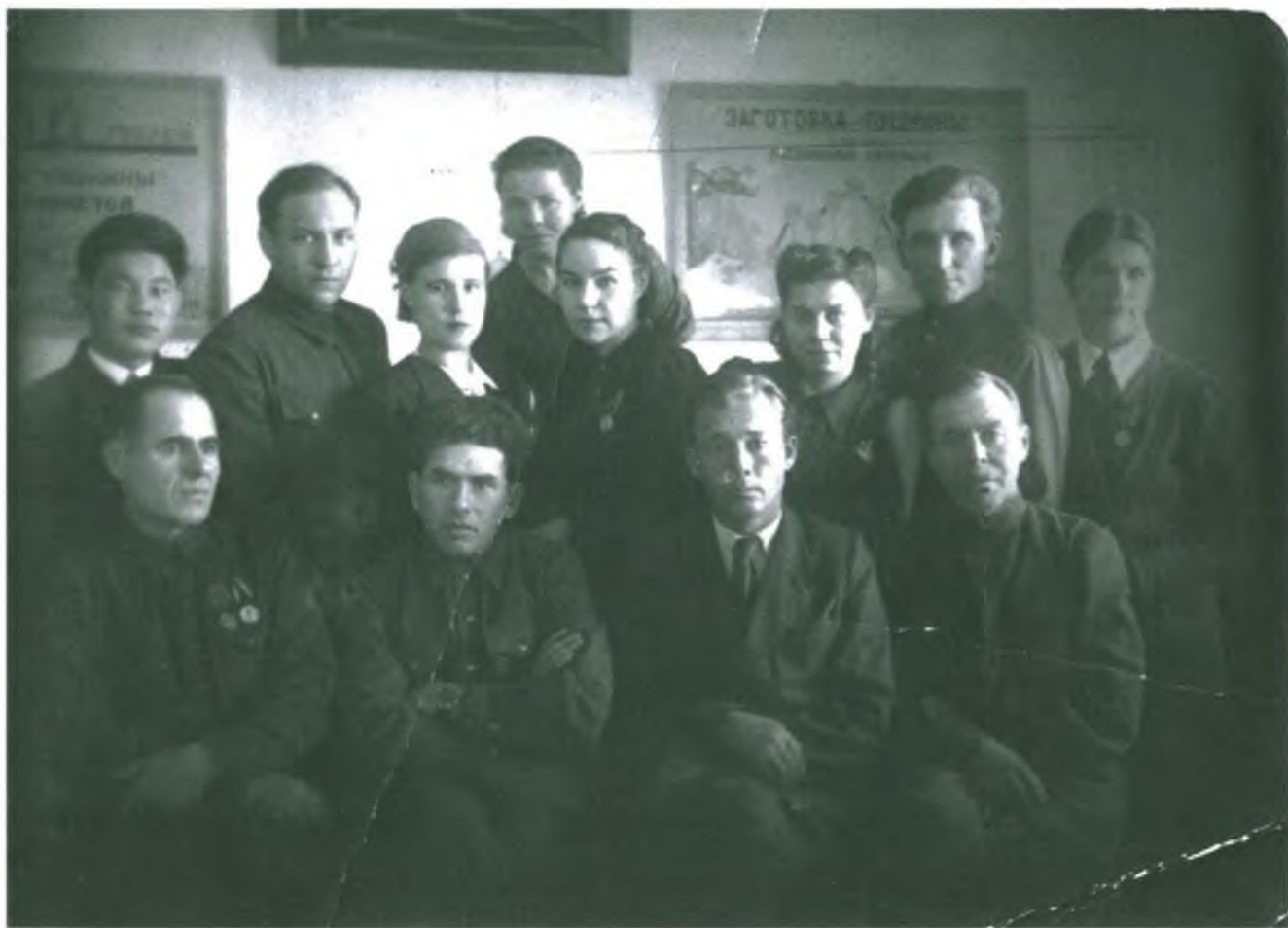
1945 г. Коллектив Оккрыболовпотребсоюза.

Старая фотография. С нее молчаливо смотрят на нас, на наши дела верные друзья-товарищи. Спасибо им за то, что они были и есть, за то, что не предали дело, которому верно служили. Их труд и сами они останутся в нашей памяти.