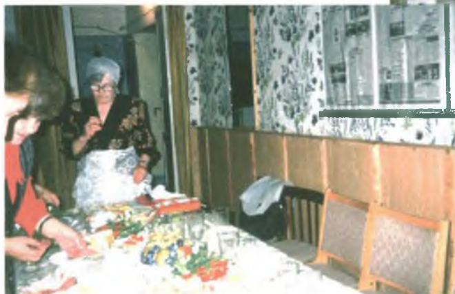
Готовят, накрывают столы