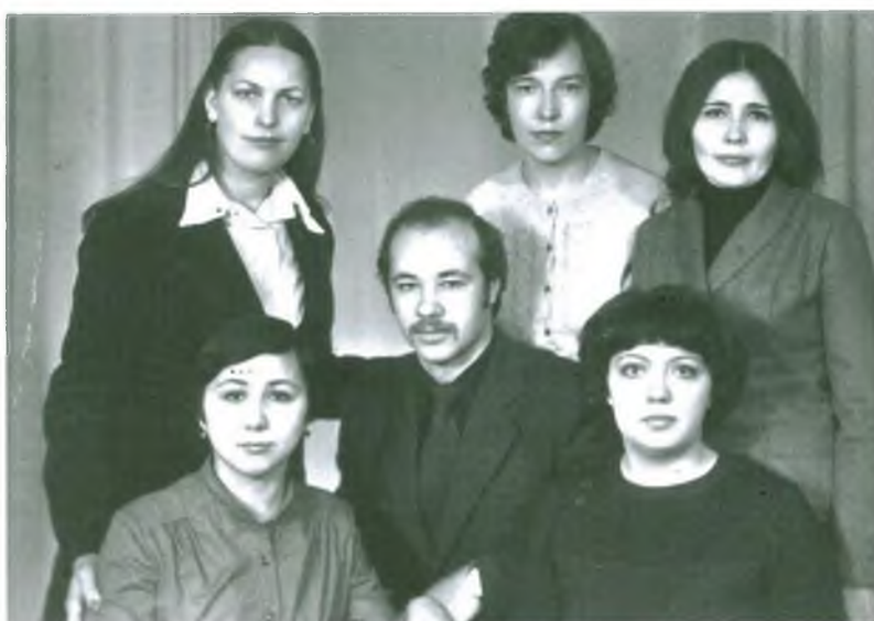
Семинар молодых специалистов, 1980 г.