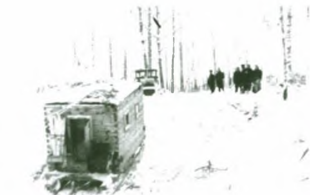
На снимке: 1956 г., Первая сейсмическая станция, которая прокладывала путь к большой нефти