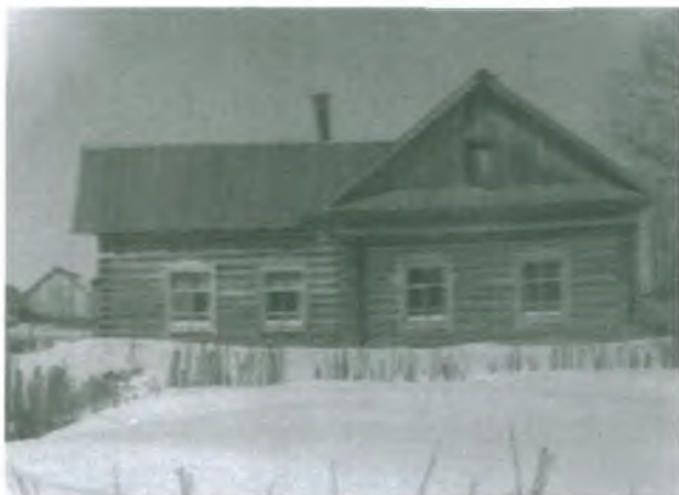
Новый Покур. Дом Сорокина В.И. Такие дома строили в 30-е годы спецпереселенцы