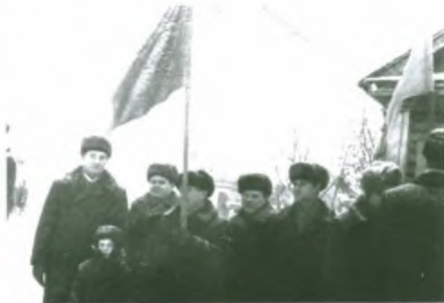
Коллектив транспортной конторы