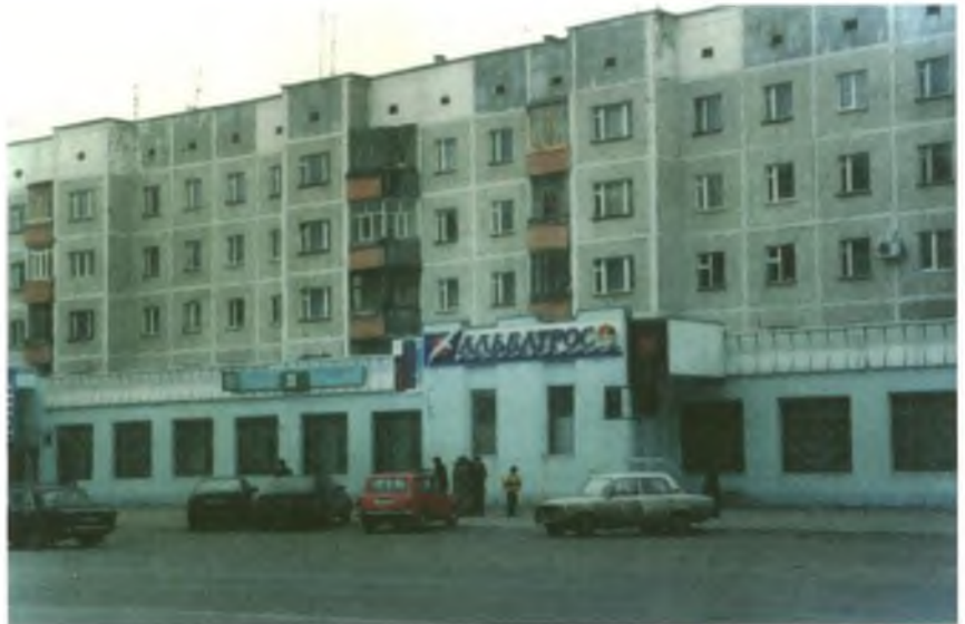
М-н "Альбатрос" П/О "ГорПО" (Ул. Ленина, 36)