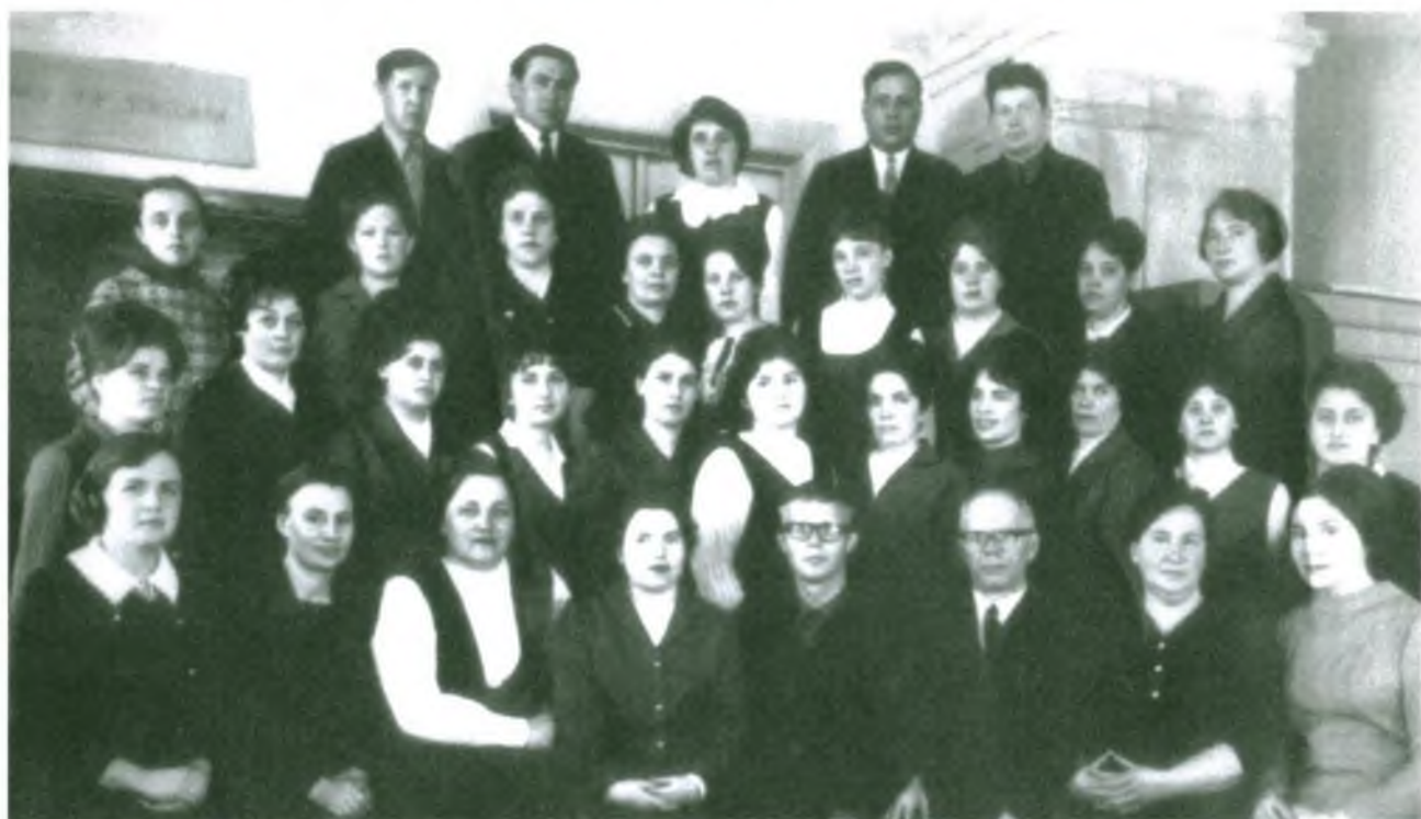
Выпускники Ханты-Мансийского-филиала Тюменского кооперативного техникума по специальностям «бухгалтер» и «экономист». Май 1966-го - 1970 г.