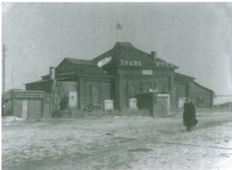
Клуб (бывшая церковь) в Покуре.