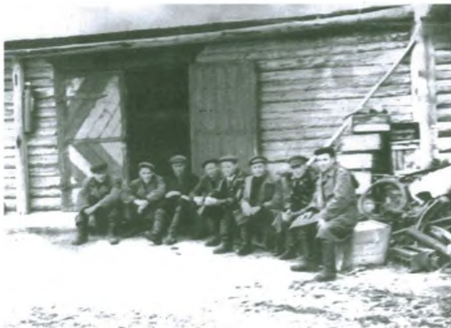
Склад №3 Сургутского рыбкоопа.