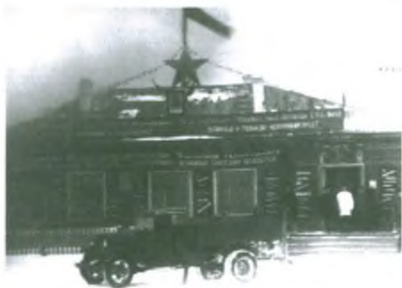
Контора горрыбкоопа. Первая и единственная тогда машина