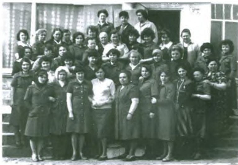
Коллектив универсама №18.