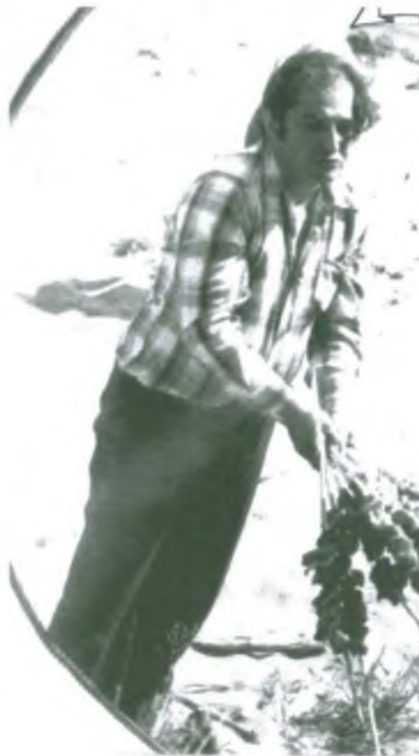
Бывший директор торговой базы