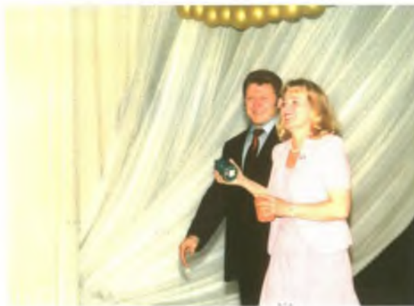
Горячими аплодисментами встречают призеров!