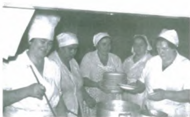
На раздаче блюд