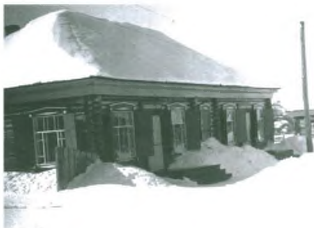
Магазин промышленных товаров в с. Покур