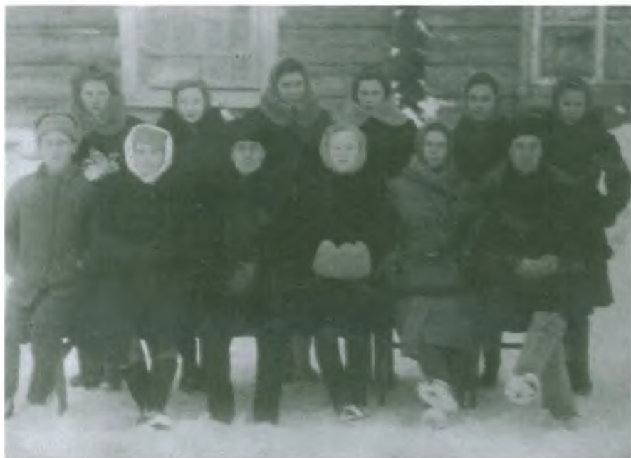
1956 год. Специалисты горрыбкоопа (слева-направо):