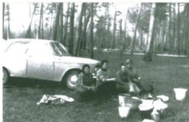
Заготовка ягод и грибов.