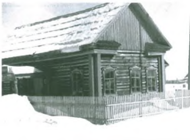
Столовая в с. Покур