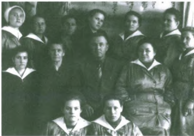
Коллектив Сургутского раймага, 1965 год.