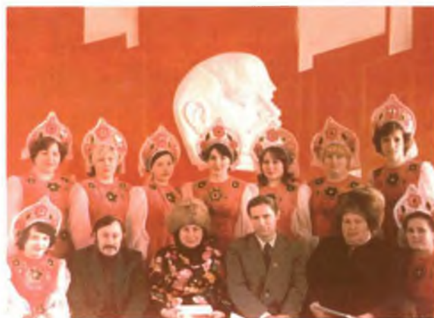
Коллектив магазина №1 на конкурсе "Лучший по профессии" занял первое место