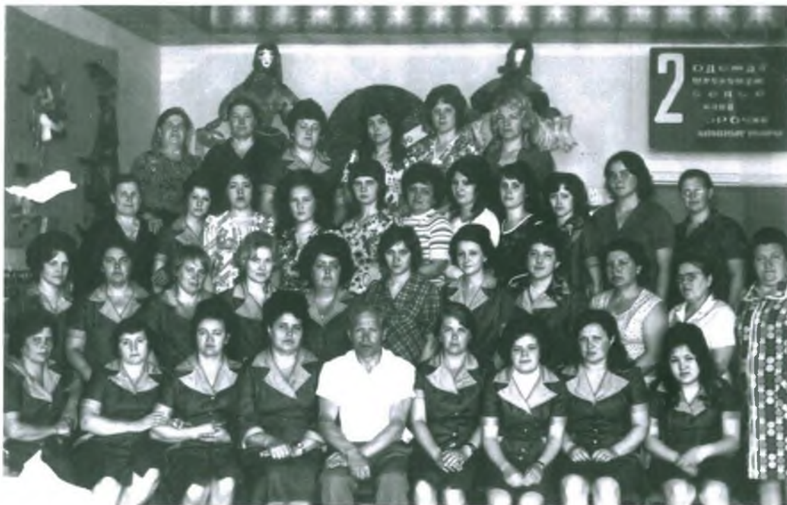
14 декабря 1976 год. Открытие универсама "Сургут".