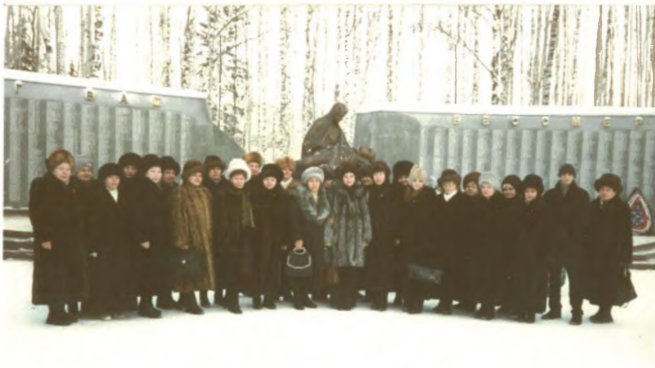
Семинар бухгалтеров, экономистов системы Облсеверпотребсоюза. 20-21 декабря, 2001 год.