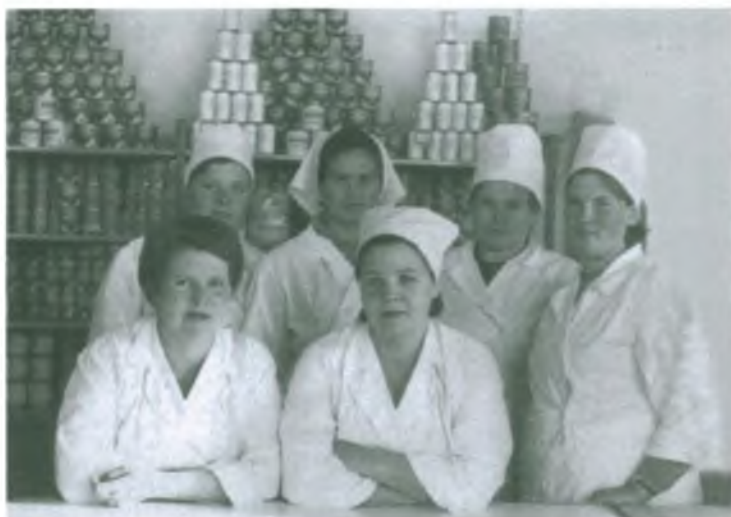
Продавцы гастронома №7