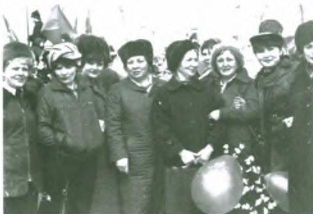
Коллектив универсама «Сургут»