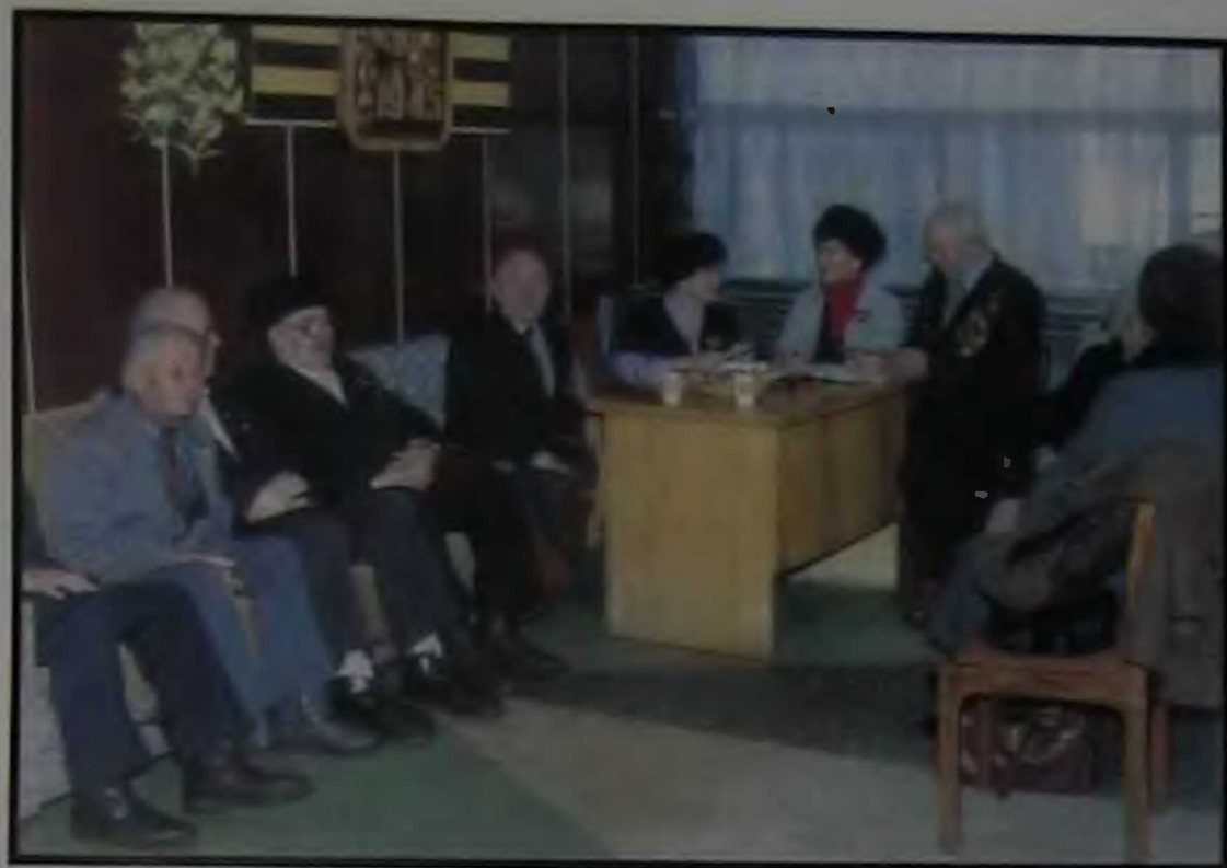
В магазине «Ветеран».

Не те уже годы и отдохнуть, прежде чем уйти из магазина, не помешает.