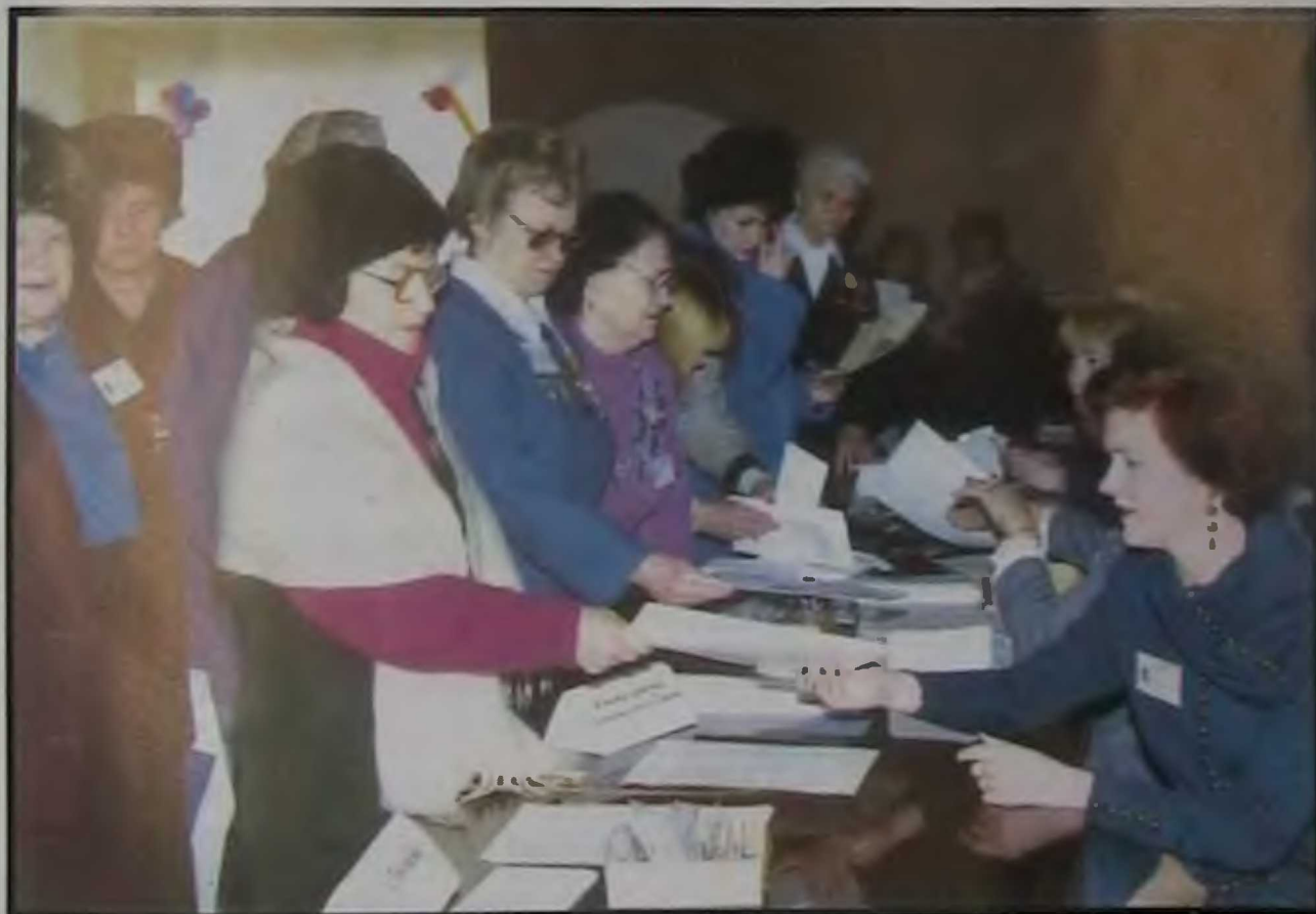
Областной слет женщин - участниц войны, прошедший под названием «У войны - не женское лицо». Регистрация участников слета.

Я знаю эти руки с детских лет. Я уставал — они не уставали. И маленькие, свой великий след. Они всегда и всюду оставляли.