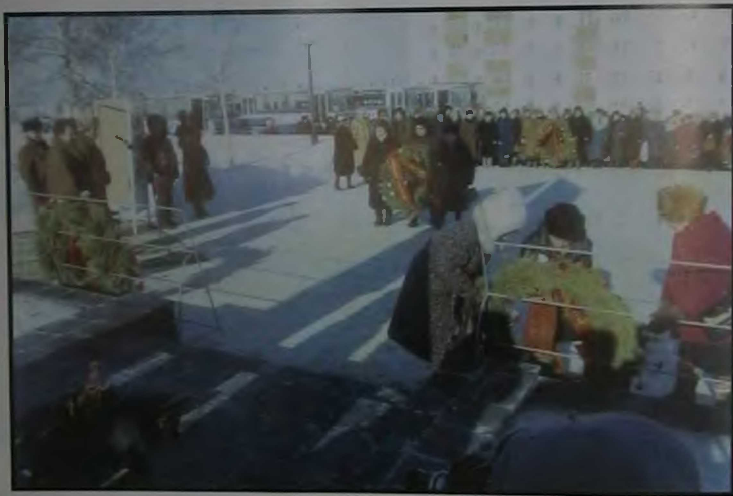
9 мая 1994 года. Возложение венков.

Тревожит прошлое ночами, Зовя в атаку каждый раз. Оно не растает с нами, Оно не где-нибудь, А в нас.