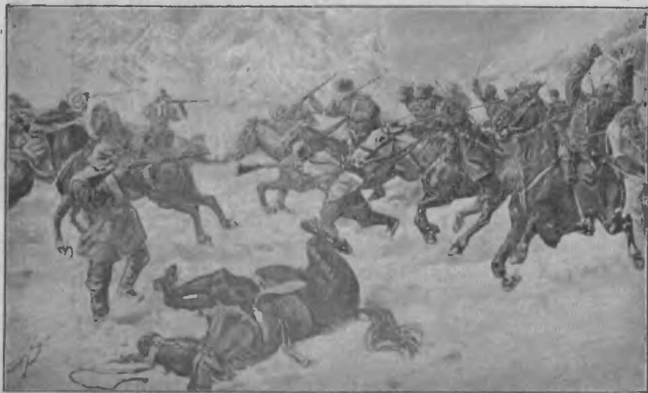
Стычка между казаками и хунхузами въ Манчжуріи.

зовъ и заставило ихъ удалиться въ самыя дикія, ненаселенныя мѣстности, отдаленныя отъ большихъ дорогъ. Это озлобило хунхузозъ и противъ населенія, сочувствующаго русскимъ, и съ тѣхъ поръ они заявили себя открытыми грабежами и нападеніями на деревни, и на манчжурскую желѣзную дорогу. Такъ, въ 1900 г. хунхузы, собравшись въ огромныя шайки и удалившись въ ущелья дикихъ Чань-бо-чжанскихъ горъ, предпринимали дерзкія нападенія на населеніе и на желѣзную дорогу. Лишь въ 1901 г. удалось наконецъ русской экспе-