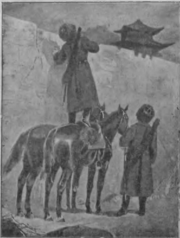
Казаки на развѣдкахъ въ Корей.

Генералъ Мищенко съ шестью сотнями двинулся къ городу Чончю. Тамъ оказались рота и эскадронъ японцевъ. Казаки спѣшились и огнемъ принудили японцевъ укрыться въ фанзы. Спѣшившіе въ Чончю на выручку три эскадрона японцевъ встрѣчены были тоже