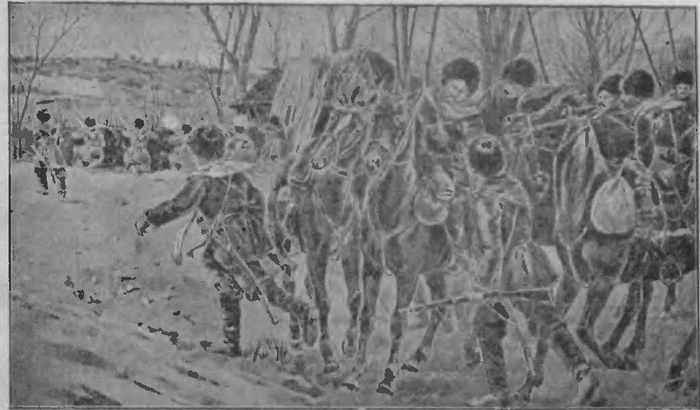
Первая стычка казаковъ съ японцами (по наброску очевидца).

17 мая въ бою при Вафангоу сибирскіе казаки вихремъ налетѣли на японскую кавалерію съ пиками на перевѣсъ, охватили ее съ обоихъ фланговъ и въ нѣсколько минутъ буквально истребили эскадронъ, разсѣявъ остальныхъ. Пики паводили ужасъ. Были удары, когда казаки пробивали насквозь всадника и ранили лошадь. Нѣсколько пикъ оставлено за невозможностью выдернуть ихъ. Во время битвы разразилась гроза. Нѣсколько японскихъ кавалерійскихъ атакъ удивляли; во время атаки они бросались на русскихъ съ криками „маіа“. Были эпикоды, просившіеся на полотно. Японцы потеряли не менѣе 200 чел. въ этой схваткѣ и казаками взято много японскихъ лошадей.