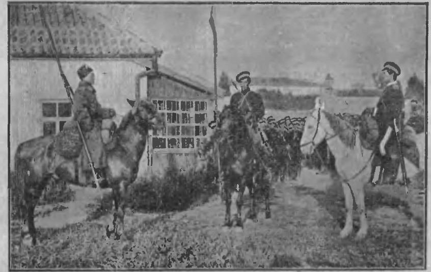
Оренбургскіе казаки у себя дома.

ными глазами и обросшій обыкновенно бородой, сибирскій казакъ при встрѣчѣ съ непріателемъ можетъ навести страхъ однимъ только своимъ видомъ. Почти всѣ они очень хорошіе наѣздинки и любимая забава ихъ—джигитовка, т. е. скачка наперегонку на лошадиныхъ, во время