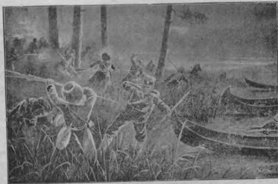
Стычка команды охотниковъ казаковъ съ японцами у рѣки Ялу.

Съ каждымъ днемъ теперь шансы воюющихъ сторонъ все болѣе и болѣе уравниваются, а черезъ нѣкоторое время перевѣсъ окажется на нашей сторонѣ и въ этомъ нѣтъ никакого сомнѣнія. Напрасно крикуны напрягаютъ голосовыя связки и изощряются въ подтасовкѣ фактовъ. Никакія выкрикиванія не измѣнятъ хода событій, но положеніе этихъ крикуновъ со дня на день будетъ становиться смѣшнѣе и незавиднѣе. Если теперь и находятся слушатели различныхъ гнусныхъ басенъ, то только потому, что слишкомъ больно отзывались на насъ извѣстія о потеряхъ, уже