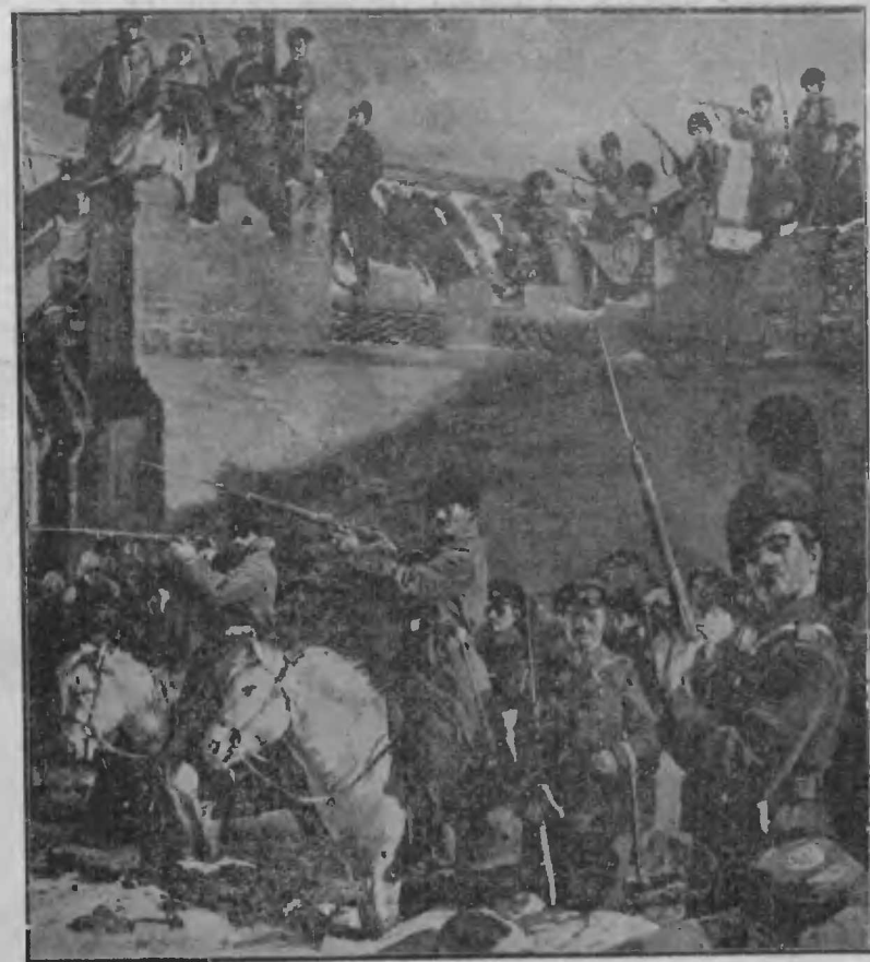
Защита казаками занятой позиціи.

Отъ Таоляна до Чончю дорога идетъ почти все время по долинамъ, стѣсненной съ обѣихъ сторонъ горами.