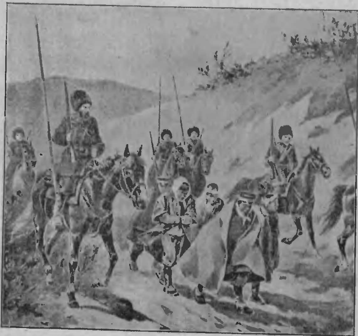
Пойманные казаками шпіоны (по наброску очевидца).

При всѣхъ первыхъ столкновеніяхъ съ японскими развѣздами, казаки обращали ихъ въ бѣгство, а иногда даже отнимали у нихъ лошадей. Эти успешныя дѣйствія служатъ залогомъ тѣхъ большихъ услугъ,