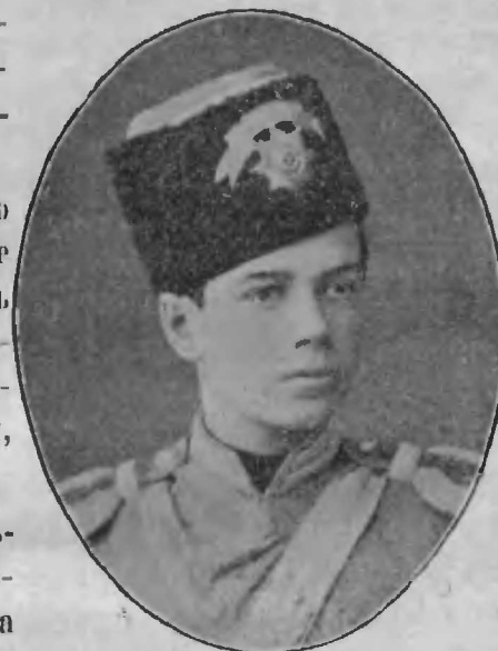
Его Императорское Величество ГОСУДАРЬ ИМПЕРАТОРЪ Николай Александровичъ въ 1884 г.

Излюбленнымъ райономъ этой вольницы являлся Донъ, съ береговъ котораго казачество распространялось на Волгу, Терекъ, Уралъ, проникнувъ затѣмъ постепенно и въ глубь далекой Сибири.