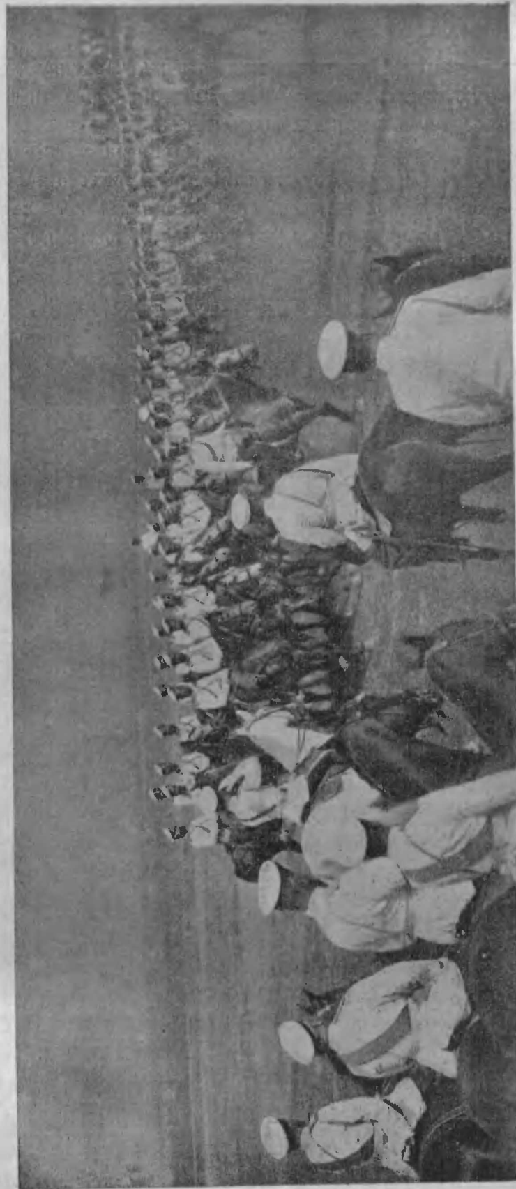
Прохожденіе казаковъ на смотръ предъ Государемъ Императоромъ.

Воинская повинность общеобязательна для всего мужского населенія. Льготы по отбыванію воинской повинности крайне ограничены, причемъ льгота по семейному положенію имѣетъ условное значеніе, т. е. она дается только въ томъ случаѣ, если это представится возможнымъ по разряду наряда даннаго года. Срокъ службы каждаго казака продолжается 20 лѣтъ. Этотъ срокъ распределяется по разрядамъ слѣдующимъ образомъ: 3 года (отъ 18—21) казакъ состоитъ въ приговорительномъ разрядѣ, въ коемъ онъ получаетъ живя дома, предварительную подготовку къ военной службѣ; 12 лѣтъ (съ 22—33)—въ строевомъ, изъ коихъ на дѣйствительной службѣ, въ первой очереди, казакъ долженъ пробыть 4 года, а остальные 8 лѣтъ на льготѣ во 2-й и 3-й очереди, по 4 года въ каждой. По окончаніи службы въ строевомъ разрядѣ, казаки зачисляются на 5 лѣтъ (33—38) въ запасный, который предназначается для пополненія убыли въ строевыхъ частяхъ въ военное время и для сформированія въ военное же время особыхъ частей и командъ. На службу казаки обязаны выходить, имѣя утвержденныхъ образцовъ собственное обмундированіе и снаряженіе и, кроме того, собственную верховую лошадь.