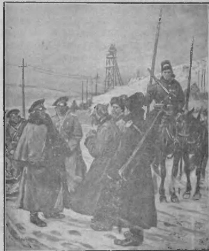
Поимка шпионовъ на Сибирской желѣзной дорогѣ.

Ихъ Талыянванъ и Ліуданзырь—это тѣ же удалые казаки Стевѣ-ка Разинъ и Кондратій Булавинъ, изъ которыхъ выработались Платовы, Краснощекы и Павайскіе.