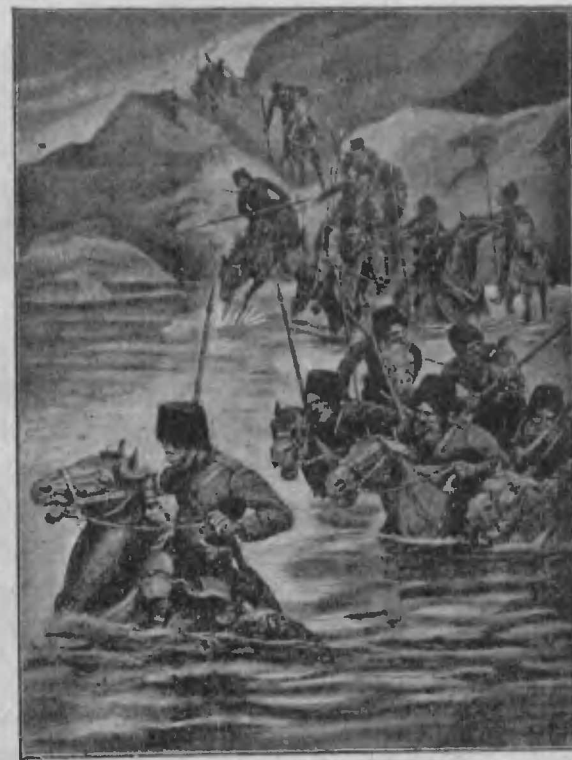
Казаки изъ отряда ген. Мищенко переправляются черезъ рѣку Ялу 29 марта.

Хотя для такого незначительнаго отряда достаточно было бы и одного перевязочнаго пункта, но, вѣроятно, въ виду большого числа