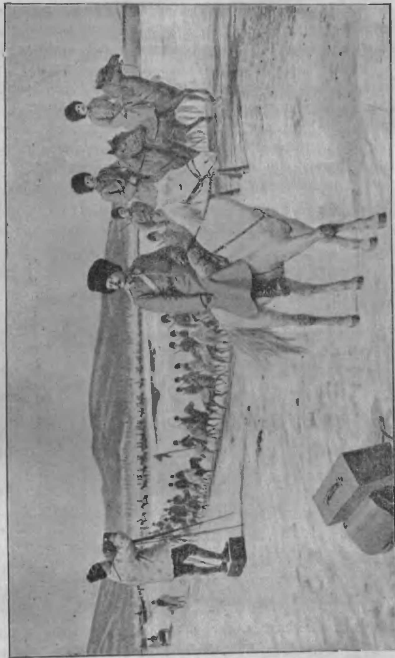
Синематографъ при прохожденіи казаковъ.

продовольственными и аммуниціонными складами, приготовленнымъ обо-