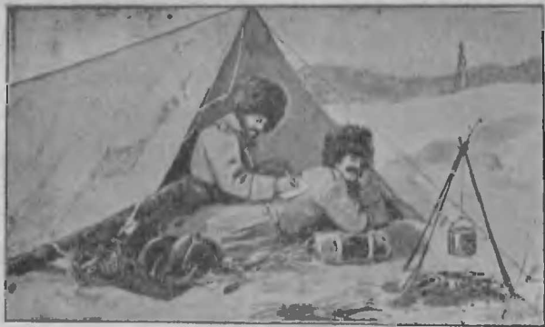
Приваль казаковъ на охотѣ.

„Однажды шестнадцать казаковъ отправились отыскивать тигра, патворившаго у нихъ много бѣдъ. Для большаго удобства они раздѣлились. Вдругъ, выскочивъ совершенно неожиданно изъ куста, тигръ