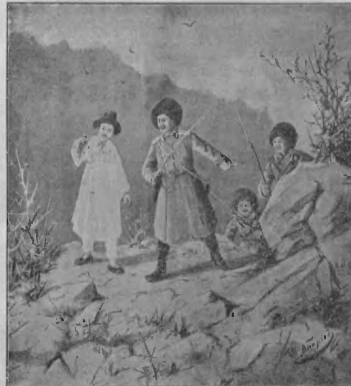
На развѣдкахъ.—Вы слѣдили.

наступление японцевъ. Они надѣялись пересѣчь имъ путь и атаковать ихъ за переваломъ Мануніонъ, но въ виду того, что мѣстность здѣсь весьма трудная и пересѣчная, а японцевъ оказалось очень много, казаки были возвращены.