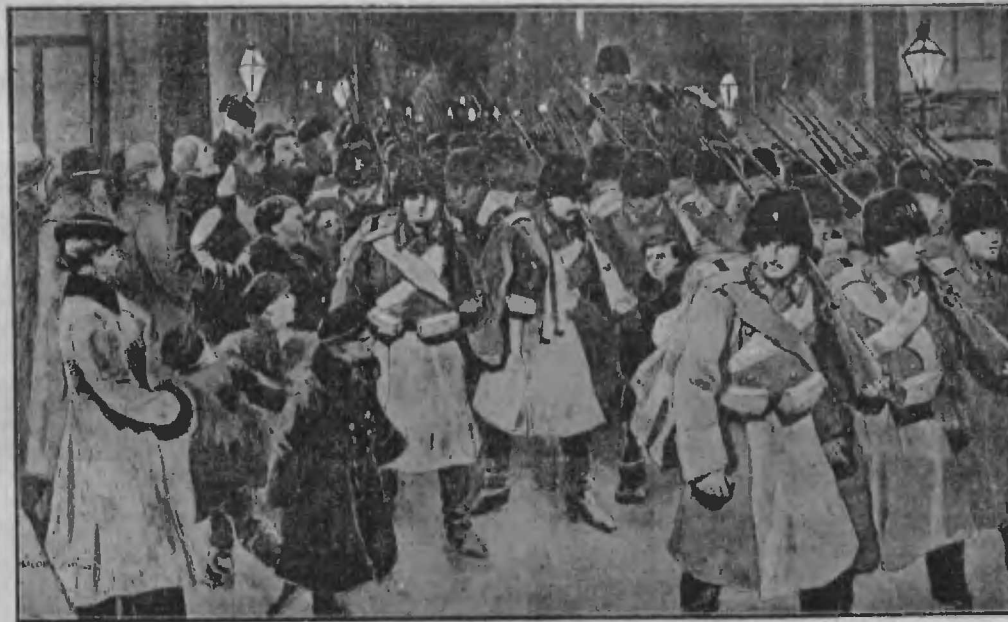
Пѣшій батальонъ Забайкальскихъ казаковъ

Невозможно даже приблизительно перечислить все военныя хитрости, на которыя способны казаки. Вотъ, напр., казачья передовая цѣпь столкнулась съ японцами и открылась перестрѣлка. Сидѣвшіеся казаки сгруппировались и засѣли въ кустахъ, энергично все поддерживая перестрѣлку. Непріятель тоже стянулся и направляетъ весь свой огонь въ кусты. Казаки отвѣчаютъ все меньше и меньше, непріятель, предполагая, что его огонь оказался губительнымъ и стрѣльба выбила многихъ изъ строя, сосредоточиваетъ свои силы и бросается наконецъ