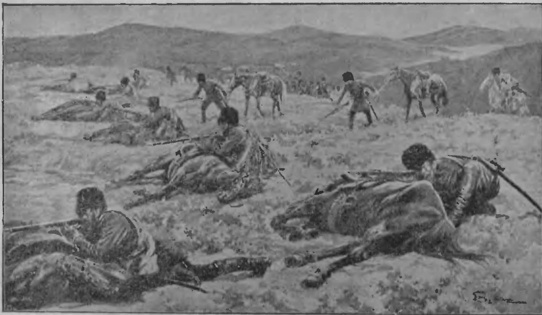
Авангардные казаки въ роли стрѣлковъ.

Благодаря нашему выгодному положенію, мы могли обстрѣливать противника съ двухъ сторонъ перекрестнымъ огнемъ.